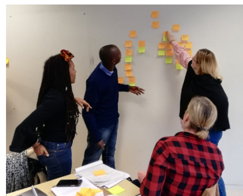
Formation à l'analyse d'accidents, ESEQ Montpellier, janvier 2020

La vérification de l'acquisition des compétences opérationnelles au cours de la formation passe par des mises en situation (jeux de rôles, audit documentaire, mise en application des exigences des normes ou référentiels, jeux pédagogiques, travaux intersessions réalisés sur le terrain, ...). Un questionnaire d'évaluation des acquis vient clôturer la session de formation afin de valider la bonne compréhension des principaux aspects théoriques.