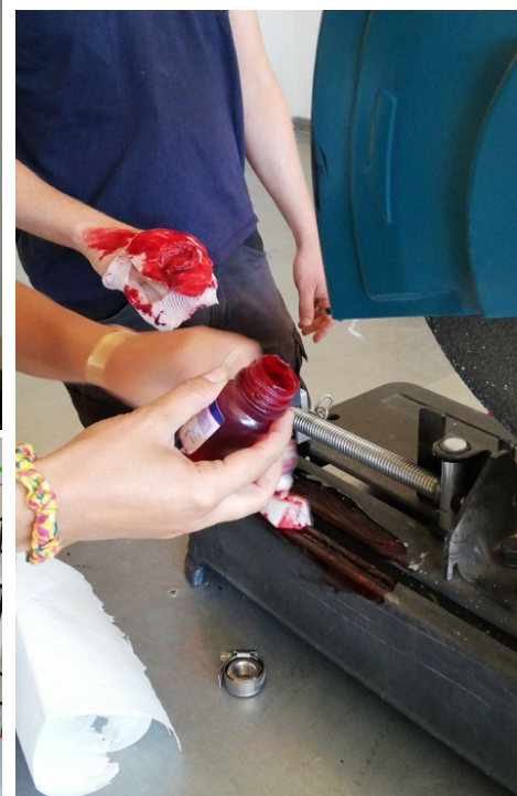
Journée sécurité de l'entreprise EYCO (13), organisée en partenariat avec ADVANCE SOLUTIONS et APEXYA, juillet 2023